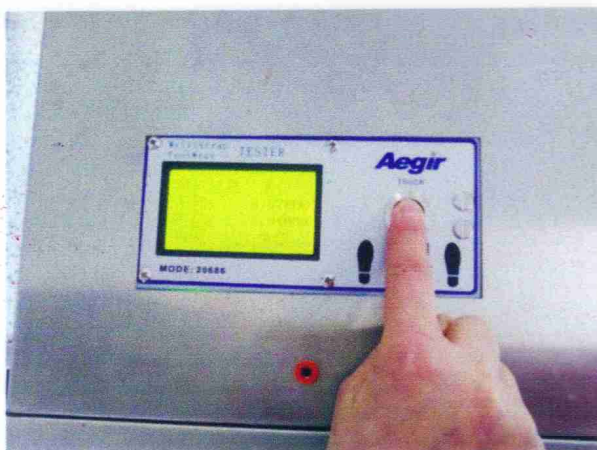
3.食指或拇指按下测试按钮