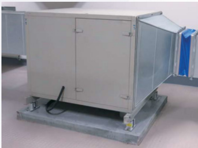
风柜搭配安装 JKF 型