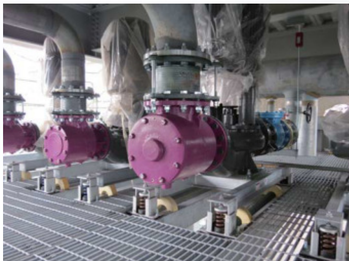
水泵及过滤器搭配安装 JKM 型