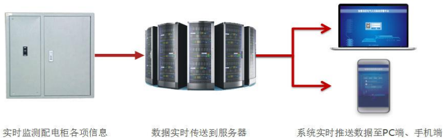
电气火灾隐患排查平台之数据推送

智慧用电安全监控系统，可以不受时间、地点、环境的限制，自行选择合适方式（本地电脑、手机 APP、短信）来掌控用电系统的运行情况，真正做到“早预防、快报警、自诊断、出报告”的全面工作流程优化。