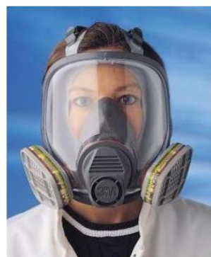
国产红外测油仪四氯化碳萃取实验