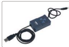
数据传输线(选配) 型号7302-SPC5