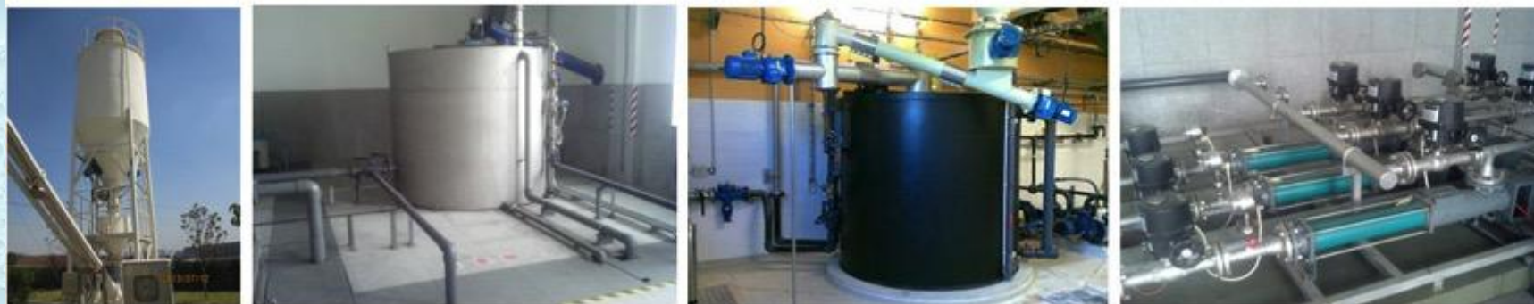
粉体投加和溶液制备系统