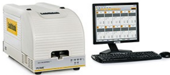
图 1. OX2/23 氧气透过率测试系统

采用 Labthink 兰光 OX2/230 氧气透过率测试系统,检测八宝粥塑料碗的氧气透过率检测。设备如图 1 所示。仪器符合 GB/T 19789、ASTM D3985、ASTM F2622、ASTM F1307 等测试标准,适用于塑料薄膜、高阻隔性材料、太阳能背板、片材、复合材料、镀铝膜、共挤膜等膜、铝箔、片状材料及塑料、橡胶、纸质、玻璃、金属等材料的瓶、袋、罐、盒等包装容器的氧气透过率测试。