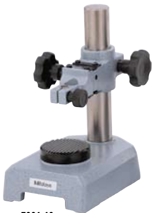
7001-10 带有 \phi 58\text{mm} 齿型测砧