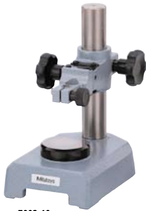
7002-10 带有 \phi 58\text{mm} 平面测砧