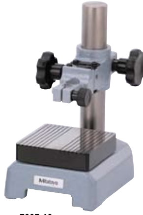
7007-10 90mm 方型测砧