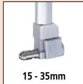
15 - 35mm