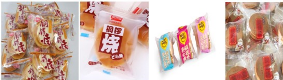
图 1 常见铜锣烧包装形式

铜锣烧，是一种烤制面皮、内夹豆沙等夹心物质的甜点，因其外形像是由两块铜锣一样的饼合起来的而得名，因其金灿灿的外表又被称为黄金饼。铜锣烧中含有丰富的营养成分，且油脂含量高，是一款对氧气比较敏感的糕点类食品。若铜锣烧在存储或销售等流通环节中，接触到的氧气量较多，则易引起其中的油脂、蛋白质等成分氧化，微生物滋生，导致铜锣烧出现酸败、哈喇等不良的风味，表面出现霉斑，因此，严格控制铜锣烧所处环境中的氧气含量是降低其发生变质概率的一个重要的举措，而铜锣烧包装用软塑包装的氧气透过率与铜锣烧所处环境条件中氧气含量的高低有直接关系。故包装材料阻氧性的优劣是影响保质期内铜锣烧品质的重要因素。阻氧性通常用“氧气透过率”表征，氧气透过率越小，说明包装材料的阻氧性越好。