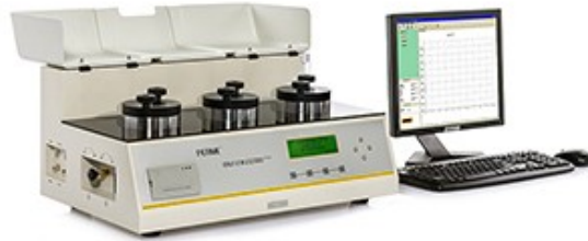
图 2 OX2/231 氧气透过率测试仪

本文利用 Labthink 兰光 OX2/231 氧气透过率测试仪检测样品的氧气透过率。